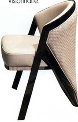
Lucky koltuk, Visionnaire.

O, tasarımın bir obje olmanın ötesinde arkasında yatan zamansızlık ve özgünlük gibi değerlerinin esas olduğuna inanan sıra dışı bir tasarımcı. Yıllar sonra profesör olarak görev yapacağı Università degli Studi of Florence'den 1980 yılında mimar olarak mezun olan Lipparini, 1987 yılında Young&Designer Milan yarışmasında ilk uluslararası tasarım ödülünü kazandı ve 1988 ve 1989 yıllarında ise Köln'deki International Du Pont ödülüne layık görüldü. Lipparini'nin ev ve ofis mobilyaları ile tekstil ürünleri üzerindeki uzmanlığı takip eden yıllarda Avrupa ve Japonya'daki pek çok firmanın koleksiyonlarına yansdı. Bir mimar ve tasarımcı bakış açılarıyla yola çıkan ve tasarımlarını marka kimliğiyle ortak bir tasarım stratejisi ile kurgulayan Mauro Lipparini, hem bireysel ve sosyal alanlar, hem mağazalar, hem de sergileme alanları üzerine odaklanmakta. Doğal bir minimalizm, temel formlar, net ve kararlı çizgiler onun temel anahtar kodları. Tasarım dünyasında Bonaldo, Arketipo, Misura Emme ve Visionnaire gibi uluslararası markalara omurga niteliğinde ürünler ve koleksiyonlar hazırlayan ve olgunlaşma döneminde Casa International markası için de koleksiyonlar hazırlayan Lipparini, organik renk paletini ve konfor duygusunu ürünlerine yansıtarak karakterize olmuş bir süperstar.