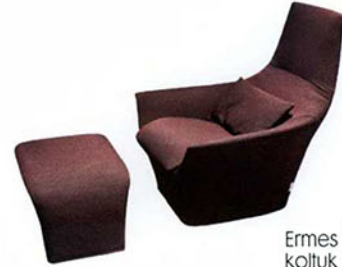
Ermes Vista koltuk ve pufu, MisuraEmme.