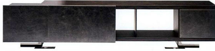
Endor ünite, Arketipo.