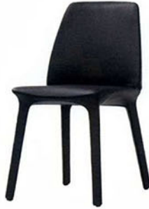
Flute sandalye, Bonaldo.