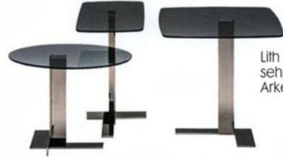
Lith sehpa, Arketipo.